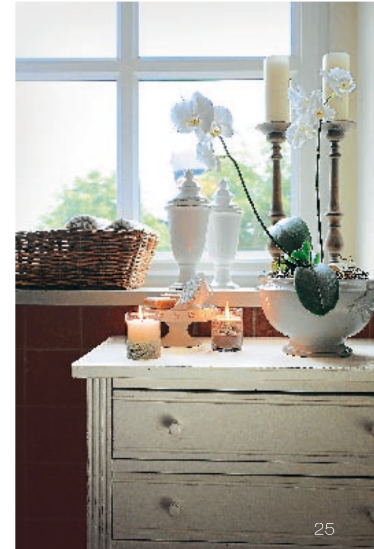
Produktion: V. Ahmadi, Anschrift auf Seite 63

STILLEBEN Auch im Badezimmer ist alles dekoriert und arrangiert: Auf der Kommode steht eine Tortenplatte mit Seifen und einem Duftsäckchen, die Handtücher liegen aufgerollt in einem Körbchen bereit. Die Schale mit der Orchidee ist eine alte Suppenterrine